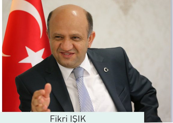
Fikri IŞIK Bilim, Sanayi ve Teknoloji Bakanı

K üresel ekonomik kriz sonrası AB ekonomisinin yeniden canlandırılması için hazırlanan «akıllı, sürdürülebilir ve kapsayıcı büyüme» odaklı Avrupa 2020 Stratejisi hedeflerine ulaşılmasında KOBİ'ler, çok önemli bir role sahiptir. Bu çerçevede, Avrupa Birliği tarafından, işletmeleri, özellikle de KOBİ'leri desteklemek üzere 2014-2020 yıllarını kapsayan, "İşletmelerin ve KOBİ'lerin Rekabet Edebilirliği Programı" (COSME) geliştirilmiştir.