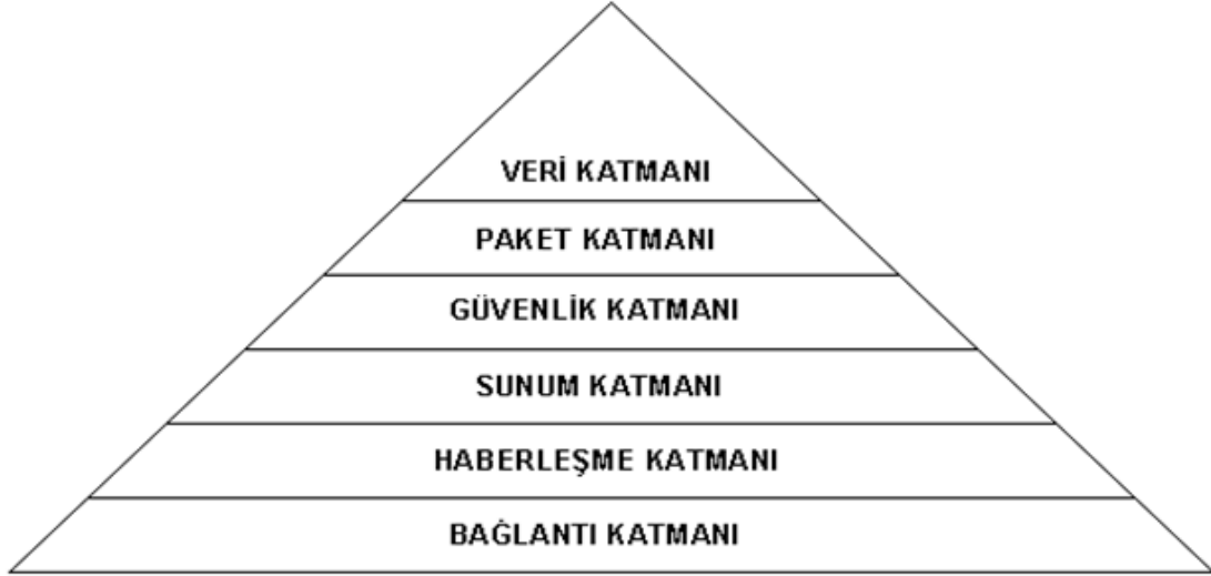
Şekil -2 : Veri Aktarım Protokolü Katmanlı Mimari

Temelde bağlantı ve haberleşme işlemlerini yöneten katmanlar, veri iletişimi için oluşturulacak web servislerinin HTTPS protokolü ile iletişim kurmalarını öngörmektedir. HTTPS protokolü için sunucu ortamına güvenilir SSL sertifikası yüklenmesi gerekmektedir.