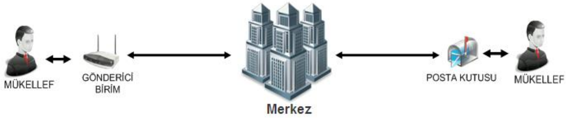
Şekil-1: Elektronik Fatura Uygulaması Kapsamında Roller

Entegrasyon sürecinde entegratör kurum yazılımını Gönderici Birim ve Posta Kutusu Birimlerinin görevlerine uygun olarak geliştirmelidir.