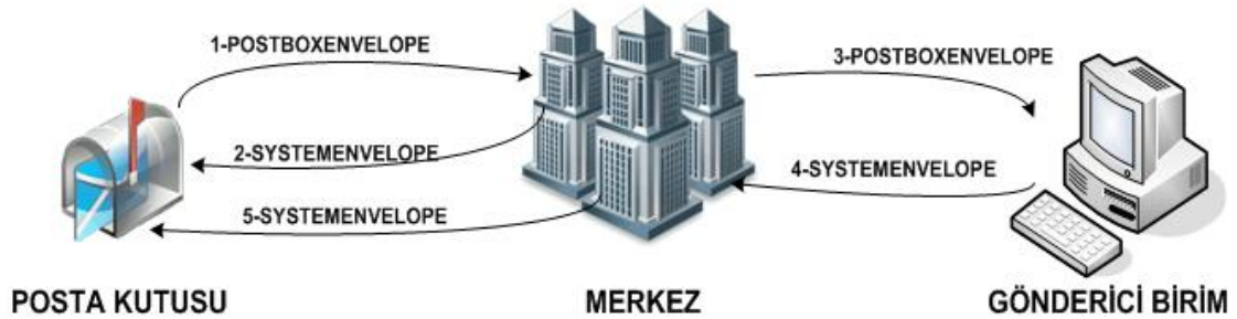
Şekil -4: Ticari Fatura Senaryosu