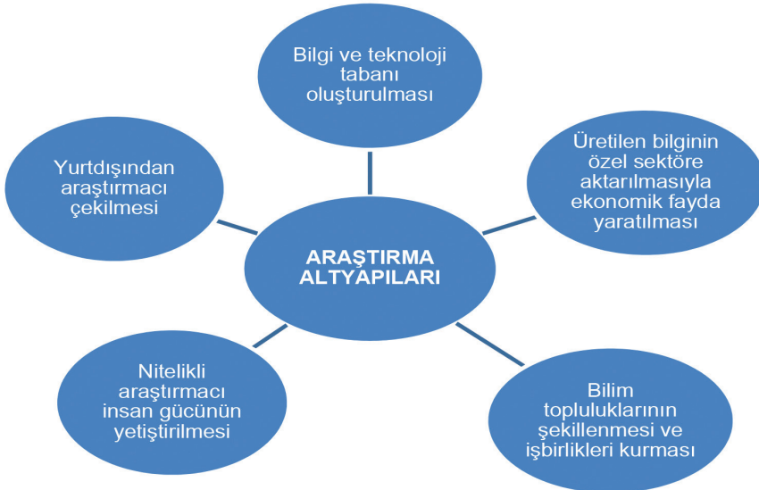
Şekil 1: Araştırma Altyapılarının Araştırma, Eğitim ve Yenilik Ekosistemindeki Yeri

“Araştırma altyapısı” terimi genel olarak bilim topluluklarının faaliyet alanlarındaki ileri düzey çalışmaları için kullandıkları makine-teçhizat ve bunların içinde bulunduğu binalar için kullanılmaktadır. Bu tanım makine ve cihazların yanı sıra bilgi ve iletişim teknolojisi imkânlarını ve araştırmacılar, teknisyenler, çalışma usulleri gibi bilgi temelli sermayeyi de kapsamaktadır. Büyük ölçekli araştırma birimleri (teleskoplar, parçacık hızlandırıcılar, araştırma gemileri gibi) yanında fiziksel olarak değişik yerlerde kurulan ve/veya sanal bir yapıya sahip araştırma imkânları da (yüksek başarılı hesaplama ve bilgi ağları gibi) araştırma altyapıları kapsamında değerlendirilmektedir.