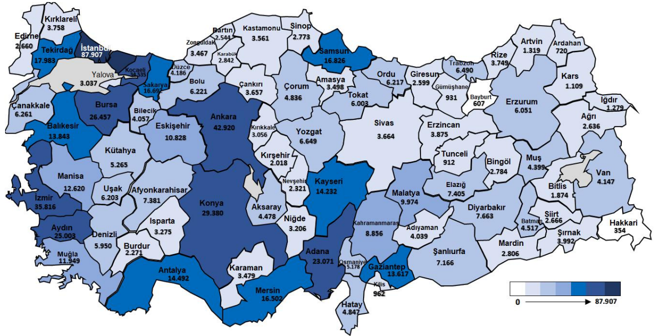
Şekil 1. İl Bazlı İşe Yerleştirme Verisi (Ocak-Ekim/2020)

Ocak-Ekim 2020 döneminde sektörler itibarıyla en fazla işe yerleştirme sanayi sektöründe “İmalat” alanında; mesleklere göre ise en fazla işe yerleştirme sırasıyla “Satış Danışmanı, Konfeksiyon İşçisi ve Güvenlik Görevlisi” mesleklerinde gerçekleştirilmiştir.