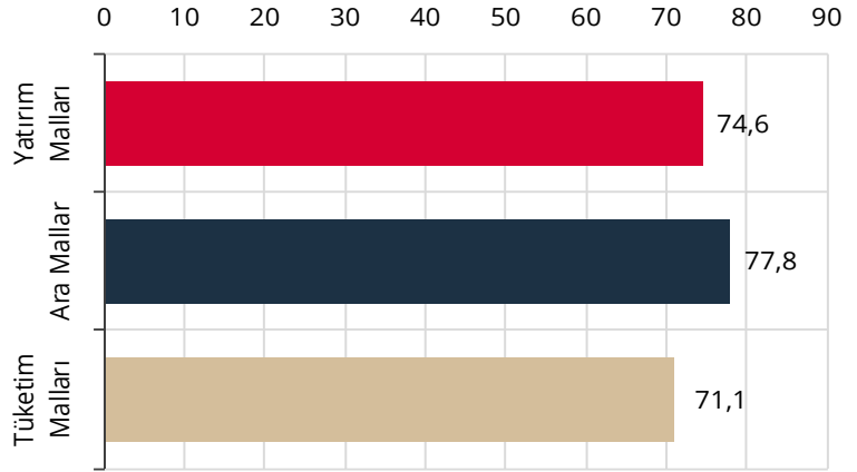
Tablo 1. KKO Toplu Sonuçlara İlişkin Gelişmeler (*)