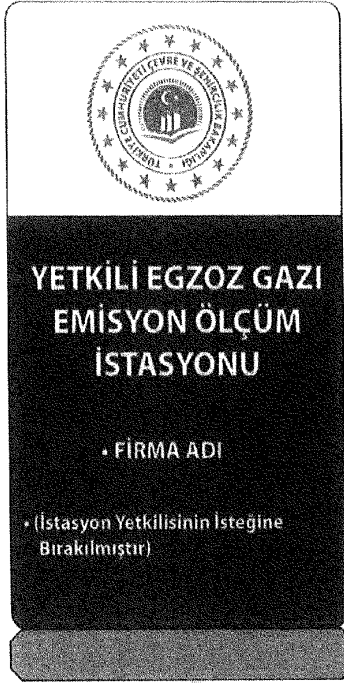
Tabela ölçüleri istasyondaki alanın fiziksel imkanlarına bađlı olarak istasyon yetkilisinin isteđine bırakılmıştır.